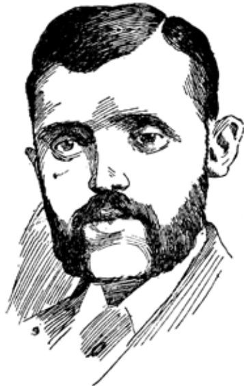
Натуралист Реймонд Ньюкомб